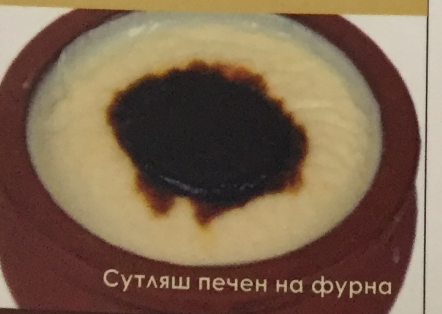
Сутляш печен на фурна