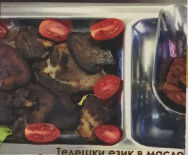
Телешки език в масло