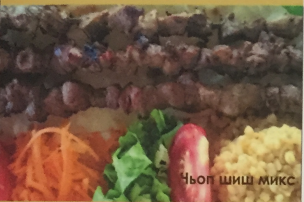
Ньоп шиш микс