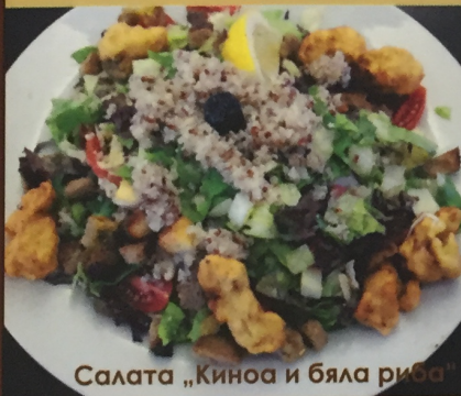
Салата „Киноа и бяла риба“