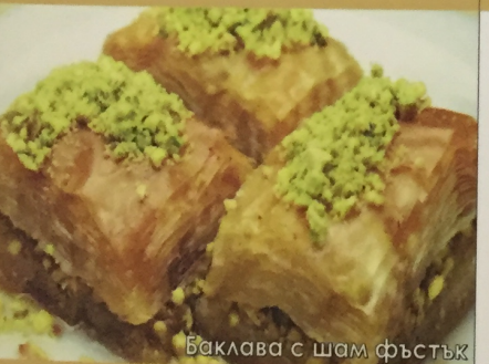
Баклава с шам фъстък