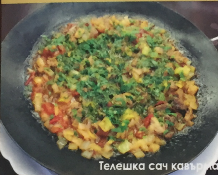
Телешка сач кавърма