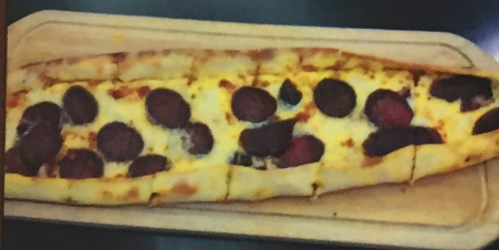
Пиде с турски суджук и кашкавал