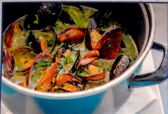
ЧЕРНОМОРСКИ МИДИ С ЧЕСЪН И БЯЛО ВИНО 600 гр.

Черноморските ни миди подлежат на сезонност. Предлагаме и други ястия с миди.