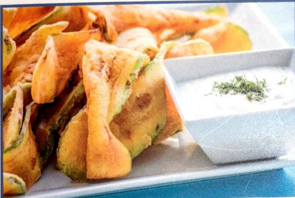
ПЪРЖЕНИ ТИКВИЧКИ ПО ГРЪЦКИ /хрупкави и изпържени до златисто, поднесени с млечно-чеснов сос/ 250 гр. 8.90

ХАЛУМИ НА ВВQ /сирене халуми, поръсено с ароматен риган/ 150 гр. 8.90